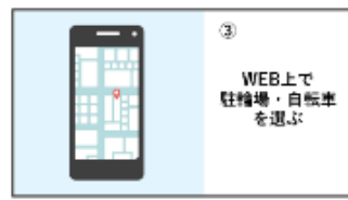
③ 駐輪場と自転車を選ぶ