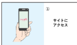
① 専用サイトにアクセス

【CHARICO ご利用方法・手順】 CHARICO 専用サイト: https://charico.jp/