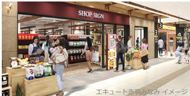
エキュート赤羽みなみ イメージ

■ 特設サイト https://www.ecute.jp/akabane/minami_open/