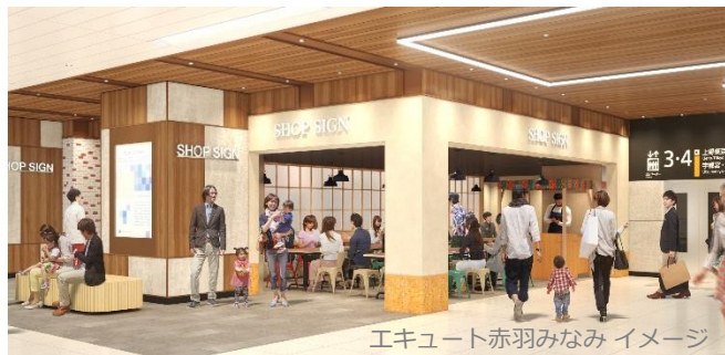
エキュート赤羽みなみ イメージ

JR 東日本グループでは「Beyond Stations 構想」に基づき、暮らしとつながる新しいサービスの提供を通じ、心豊かな「くらしづくり」を実現していきます。