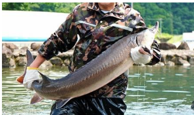
▲チョウザメの養殖