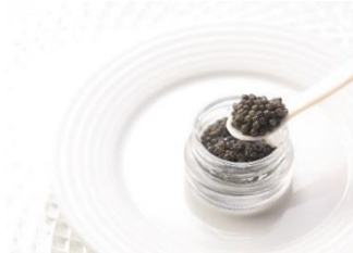
▲新見フレッシュキャビア