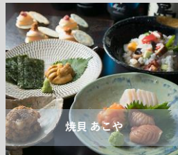
貝おためしコース 4000円(税込)