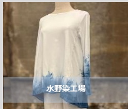
4周年記念モデル Conical tunic