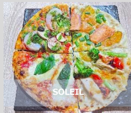
4種のよくばりピザ