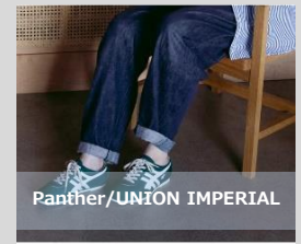
4周年 Anniversary SALE etc.

詳細はホームページをご覧ください。 https://www.jrtk.jp/hibiya-okuroji/topics/detail_00910/